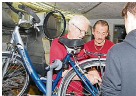
Ein Gebraucht-Fahrrad will gut durchgecheckt sein.