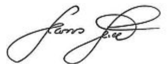
Hans Seidl, 1. Bürgermeister