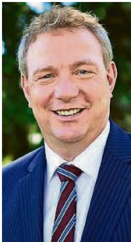
Liebe Mitbürgerinnen und Mitbürger,

die Gemeinde Maisach hat es mit großer Kraftanstrengung und der tollen Unterstützung unserer Bürgerinnen und Bürger geschafft, dass die BR-Radltour ein herausragendes Erlebnis für die 1200 Radfahrerinnen und Radfahrer und die circa 5000 Gäste der Abendveranstaltung wurde.