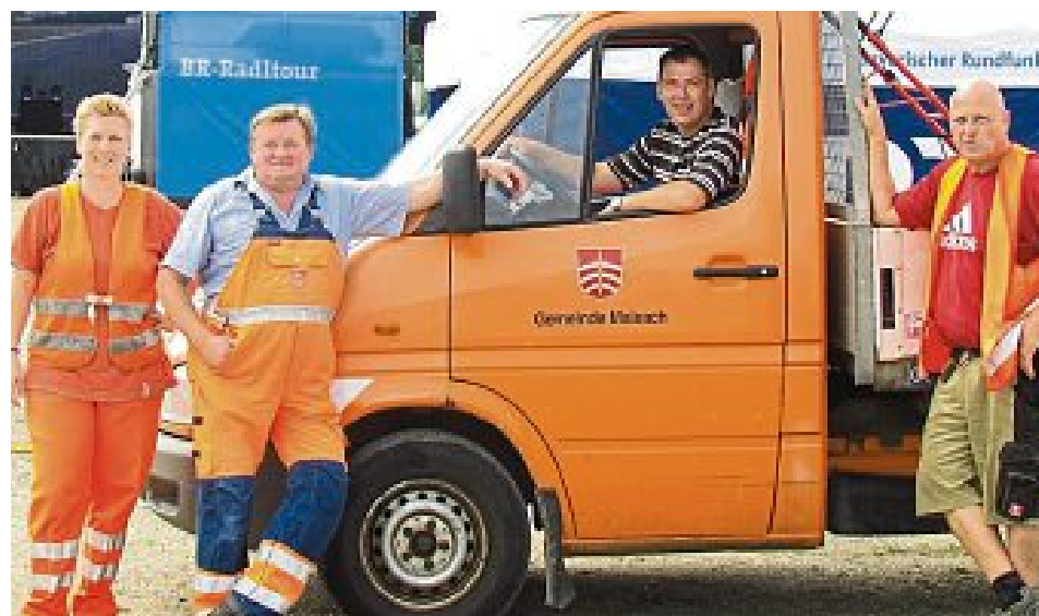
Die Bauhofmitarbeiter trugen viel zum Gelingen bei.