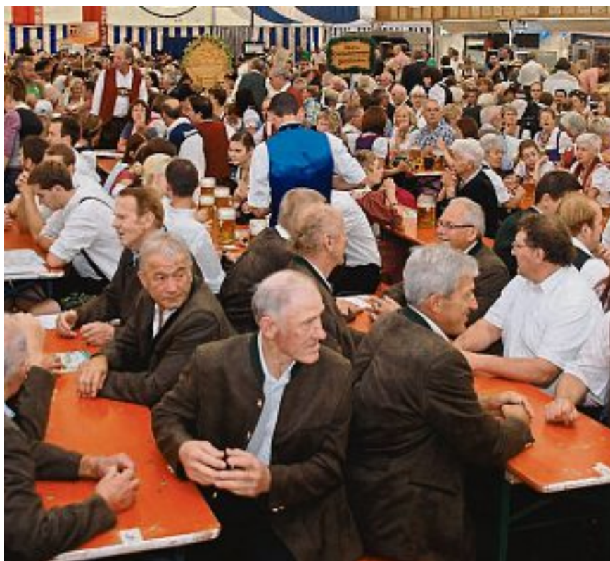
Der Auftakt der Maisacher Festwoche zieht stets zahlreiche Besucher und viele Maisacher Vereine an.

Damit Sie sicher nach Hause kommen: Taxi - Stand am Festplatz Taxi Werner: Tel. 08141/20102 Taxi Kögl: Tel. 08141/356868 Fahrservice Freitag: Telefon 08141/387292 Anrufsammeltaxi: Telefon 08141/353531