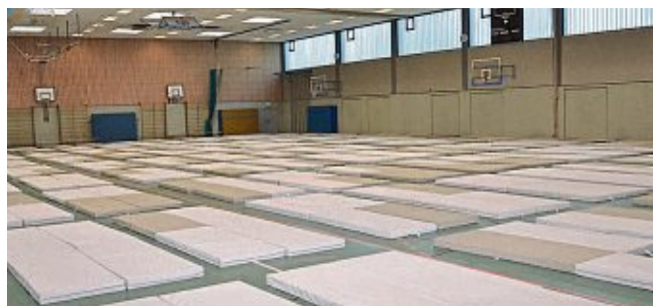
Die Turnhalle der Realschule diente der Unterbringung.