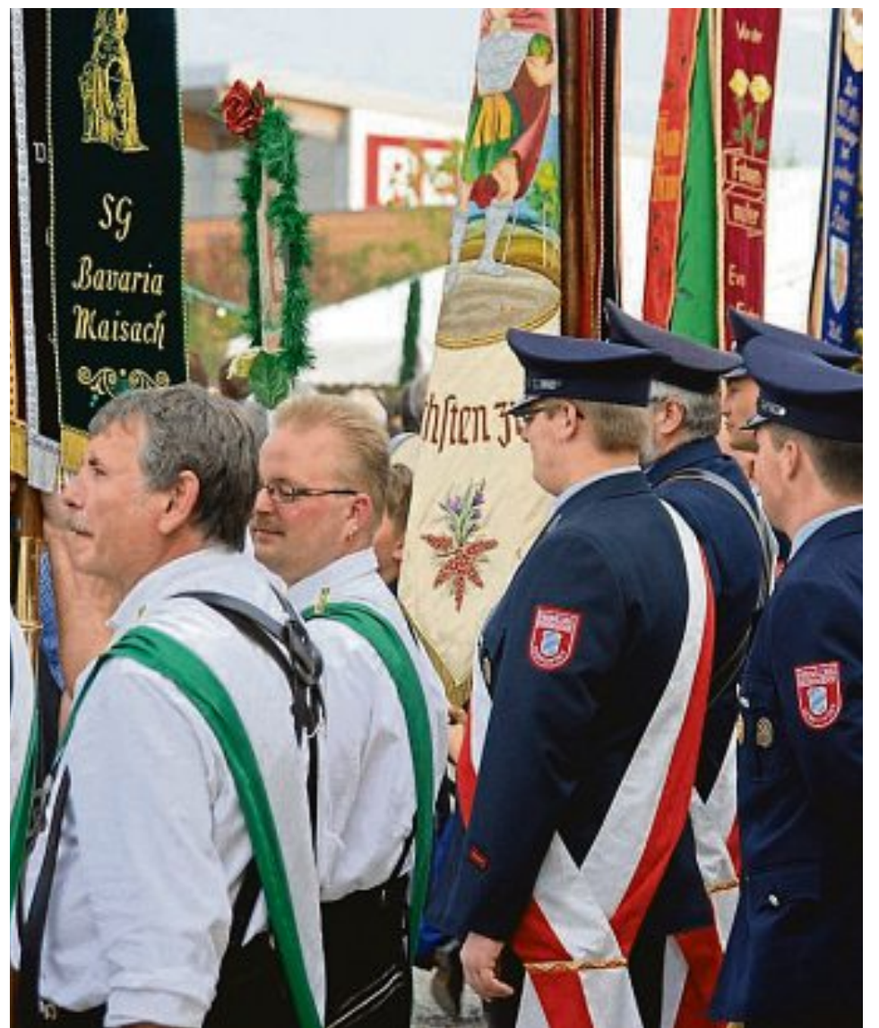
Die Fahnenabordnungen geben ein prachtvolles Bild ab, wenn die Vereine in das Festzelt ziehen.