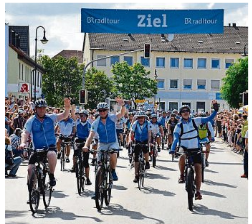
Der Zieleinlauf wurde mit Spannung erwartet.