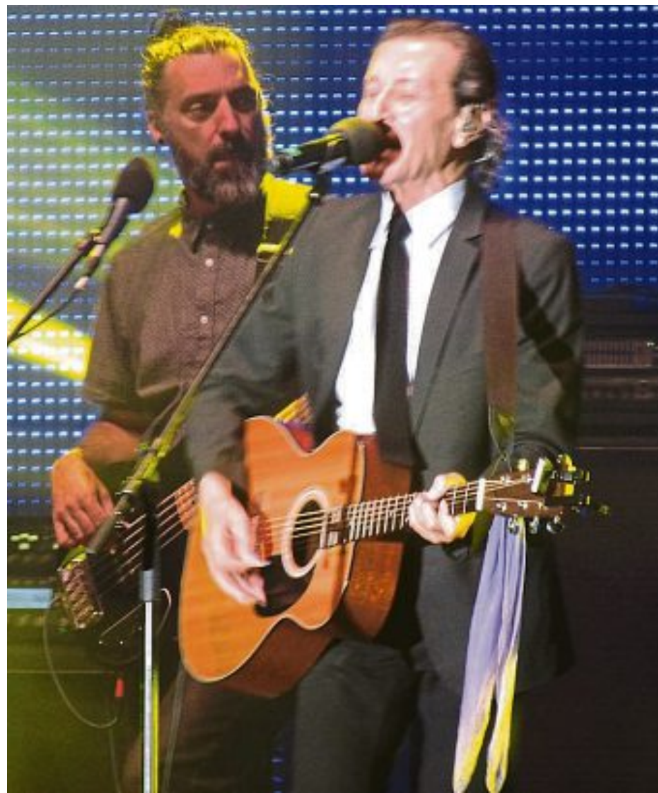
Albert Hammond begeisterte die Zuhörer mit seinen Hits.

Durch einen kurzen Regenschauer ließen sich jedoch die Besucher nicht abbringen, um pünktlich für den Hauptakt des Abends Albert Hammond bei Welthits wie „The Free Electric Band“ oder „It