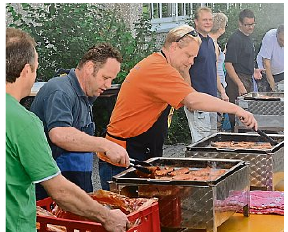
Kräftig angepackt wurde, um die Teilnehmer zu verpflegen.