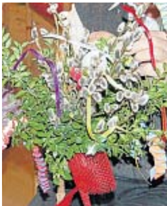
HEIMAT- UND TRACHTENVEREIN/FOTO: TB

Maisach – Mit Gruppen zu fünf Kindern je Betreuer wollen wir in aller Ruhe einen schönen Palmbuschen binden. Wir treffen uns am Freitag, 3. April, um 15 Uhr im Pfarrheim St. Vitus, im Korbinian-Raum. Das Mindestalter des Kindes sollte fünf Jahre betragen. Material wird gestellt. Der Unkostenbeitrag beträgt 4 Euro. Anmeldung bei Bärbel Rieber, erreichbar unter Telefon 08141/93252.