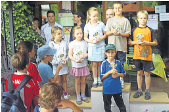
Stolz präsentieren die Teilnehmer der Ferienkurse der TG Gernlinden ihre gewonnenen Pokale.