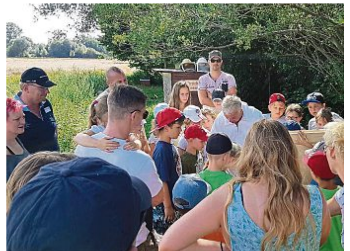
Woher kommt unser Essen, welche Nahrungsmittel werden in unserer Gemeinde erzeugt und können auch direkt beim Erzeuger gekauft werden: Diese Frage stand im Vordergrund bei der Ferienfahrt, die vom CSU-Ortsverband Maisach organisiert wurde.