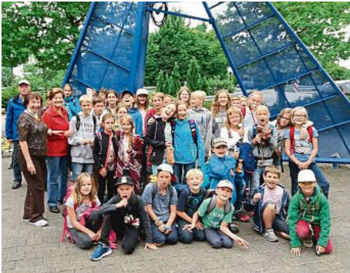
Der VdK Gernlinden organisierte einen Ausflug in den Skyline Park Bad Wörishofen. 41 begeisterte Kinder nahmen teil und waren auch nach sieben Stunden nicht müde, die Attraktionen zu erleben.