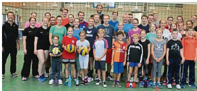
Die TSG Maisach, Abteilung Volleyball , bot in ihrem Ferienprogramm an, mit Bällen zu lernen, wie man Sport und Spaß erleben kann.