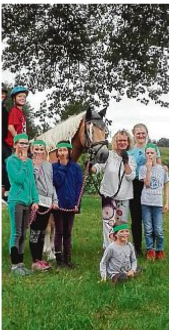
Ein Angebot der Gemeinde Maisach war das Heilpädagogische Reiten. Dabei wurde das Verhalten des Pferdes kennengelernt und anschließend in die Rottbacher Wälder gezogen, wo auch ein Tipi gebaut und abends beim Lagerfeuer Stockbrot gebraten wurde.