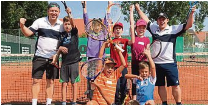
Bei der Tennismgemeinschaft Germerswang konnten die Kids einen Tennis-Schnuppertag erleben.