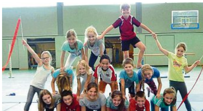
Die Turnabteilung der TSG Maisach bot in seinem Ferienprogrammangebot eine kleine Bandbreite der Akrobatik wie menschliche Pyramiden, Jonglieren, Slackline, Trampolin und mehr.