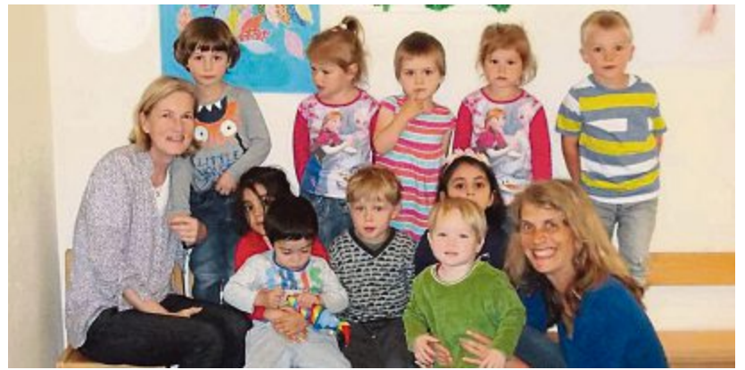
NACHBARSCHAFTSHILFE/TB-FOTO: A. BOTE

Vom Kinderpark in den Kindergarten Im Sommer verabschiedete der Kinderpark Gernlinden acht „flügge“ gewordene Kinder in den Kindergarten. Sie waren etwa anderthalb Jahre lang zweimal in der Woche vormittags zusammen mit zwei Betreuerinnen im Kinderpark in der Buschingstraße, um erste Erfahrungen ohne Mama und Papa zu sammeln. Der regelmäßige Ablauf mit Freispielzeit, Tanzen und Turnen, Basteln und Brotzeitritual vermittelte den Kindern kontinuierlich Sicherheit. Dank einer Spende aus den Reihen der Eltern konnte der Kinderpark zusätzliches Spielgerät kaufen, das nun dem „Nachwuchs“ zugutekommt, für den es noch freie Plätze gibt. Rückfragen und Anmeldung bitte direkt im Kinderpark unter Telefon 08142-478015 oder im Büro der Nachbarschaftshilfe (Telefon 08141-90877).