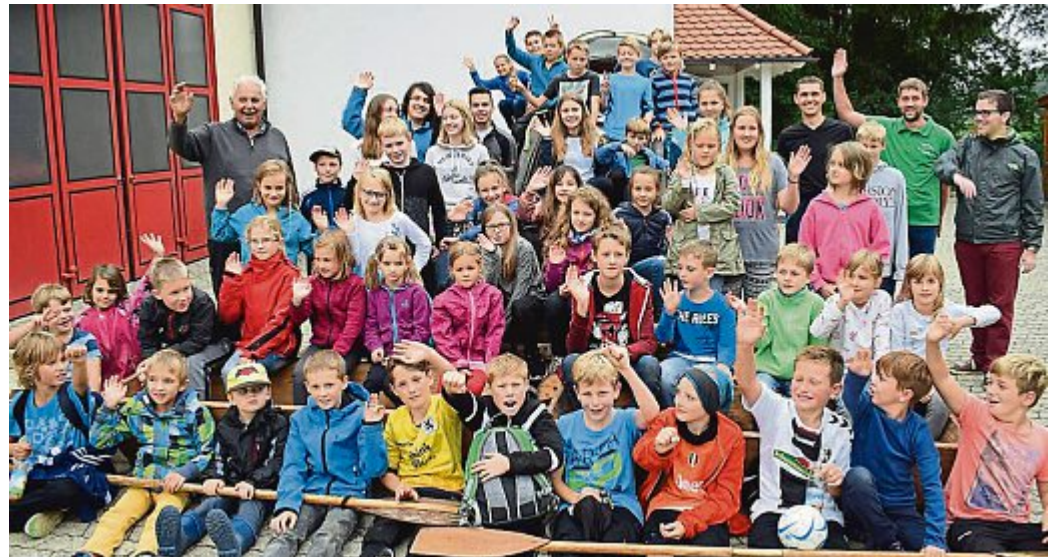
Das Sautrogrennen der Germerswanger Schützen war ein voller Erfolg. 44 Kinder sind auf der Maisach gerudert. Anschließend gab es im Schützenheim noch eine Stärkung sowie einige lustige Spiele.