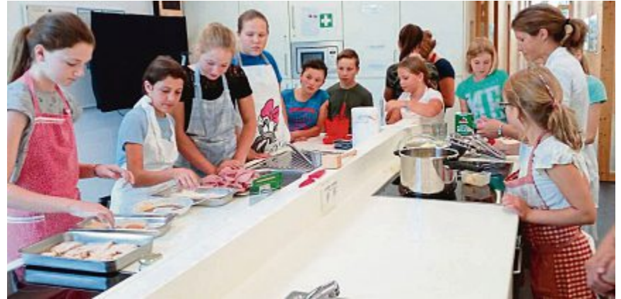
Mit 13 Kindern bereitete der Heimat- und Trachtenverein „D’Maisachtaler“ ein Caprese, Schnitzel mit Kartoffelbrei und Apfeltiramisu zu, das allen hervorragend schmeckte.