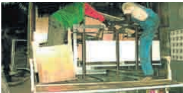
MAISACHER WÜRFEL

Schulbänke Ausgemusterte Schulbänke und Tische der Hauptschule Maisach waren mit dem Verein Aktion PiT-Togohilfe e.V. nach Togo geschickt worden, wo sie nun ins Landesinnere an die Partnerschule der Grundschule Maisach in Mattema weiter transportiert werden. Die Grundschule Maisach finanziert seit vielen Jahren die Schulspeisung in Mattema, was zu steigenden Schülerzahlen und zu mehr Platzbedarf geführt hat. Die Maisacher Togohilfe hat daher mit Unterstützung einer Firma aus Viechtach ein weiteres Schulgebäude mit zwei Klassenzimmern gebaut. Dank der Schulmöbel der Hauptschule können die Kinder in den neuen Klassenräumen nun richtig sitzen und damit auch viel besser lernen.