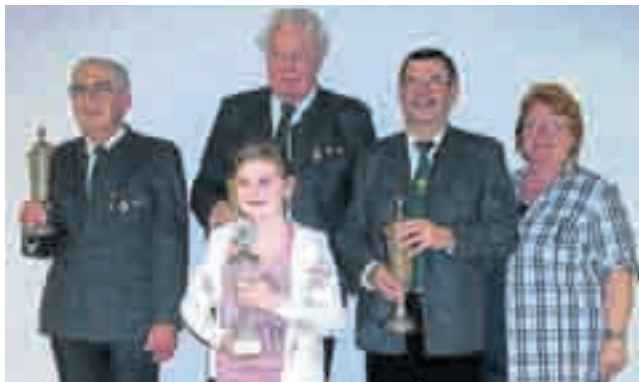
WALDSCHÜTZEN GERNLINDEN