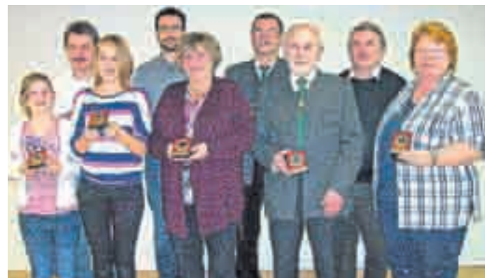
SCHÜTZENGESELLSCHAFT BAVARIA MAISACH