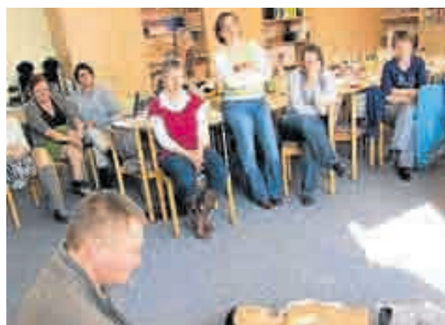
ALMRAUSSCHÜTZEN GERMERSWANG

Erste Hilfe Die Grundschule Maisach hat ihr Sicherheitskonzept optimiert und Defibrillatoren angeschafft. Herr Zieglmeier hat den Hausmeister, die Sekretärin und die Lehrer in den richtigen Gebrauch eingewiesen und die entsprechenden Erste-Hilfe-Maßnahmen durchgespielt.