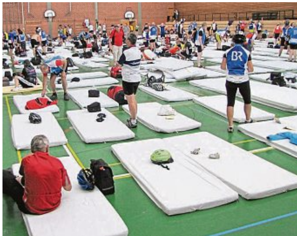
In Schul- und Turnhallen werden die Teilnehmer der BR-Radltour auch in Maisach übernachtet.

Der Zieleinlauf ist zwischen 16 und 17 Uhr in der Hauptstraße auf Höhe der Volksbank geplant. Bereits ab 15 Uhr wird hier Stimmung durch den Bayerischen Rundfunk verbreitet und alle be-