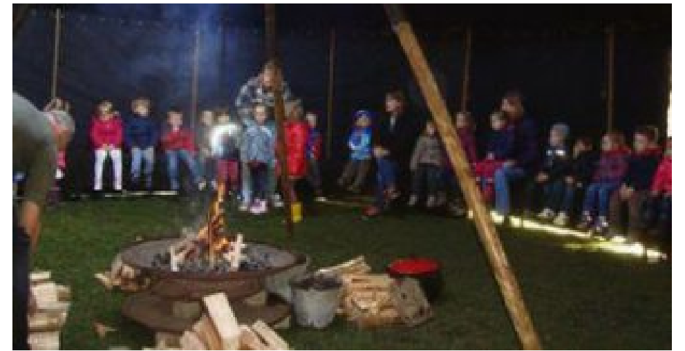
KINDERHAUS ST.VITUS

Am 27. März kam ein Märchenerzähler ins Kinderhaus St. Vitus in Maisach. Unter einem großen Zelt mit einer offenen Feuerstelle in der Mitte lauschten die Kinder gebannt den Geschichten des Märchenerzählers. Ein herzliches Vergelt's Gott an den Elternbeirat, der die Veranstaltung bezuschusst hat und an alle Eltern, die beim Aufbau und Abbau des Zeltes mitgeholfen haben. Für die Kinder war es ein besonderes Erlebnis.