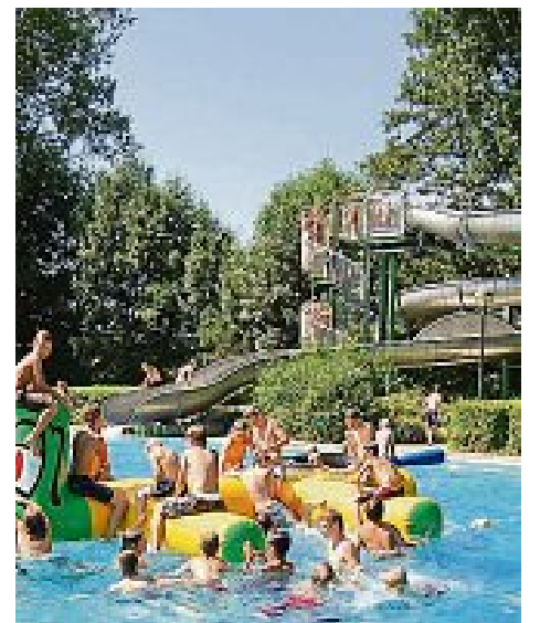
Das Freibad ist auch am Tourtag geöffnet.

Die Nacht werden die Radler in den Turnhallen und Schulgebäuden in Maisach verbringen. Am nächsten Morgen, 4. August, werden sie dort durch die Vereine verköstigt, bevor sie sich gegen 9 Uhr vom Volksfestplatz auf den Weg nach Krumbach verabschieden.