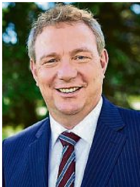
Liebe Mitbürgerinnen und Mitbürger,

am Sonntag, 3. August, werden wir im Rahmen der BR-Radltour den Etappenzieleinlauf von rund 1200 Fahrradfahrern auf der Maisacher Hauptstraße miterleben können. Neben den Radio- und Fernsehteams werden sicherlich auch viele Zuschauerinnen und Zuschauer am Zielort anwesend sein.