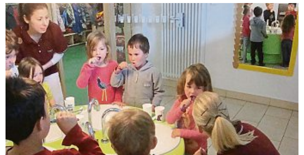
KINDERHAUS ST. VITUS

Am 7. Mai kam eine Zahnärztin mit ihrer Assistentin ins Kinderhaus St. Vitus in Maisach. Die Kinder haben gelernt, dass die Zähne nicht nur zum Essen wichtig sind, sondern dass man sie auch für eine deutliche Aussprache braucht. Außerdem kommt es zur Gesunderhaltung der Zähne nicht nur auf die richtige Ernährung, sondern auch auf eine gute Pflege an. Nach einer anschaulichen Einweisung durch die Assistentin konnten die Kinder das richtige Zähneputzen unter zahnärztlicher Aufsicht gleich ausprobieren. Wir bedanken uns bei der Zahnarztpraxis für die mitgebrachten Zahnputzutensilien und Geschenke für die Kinder.