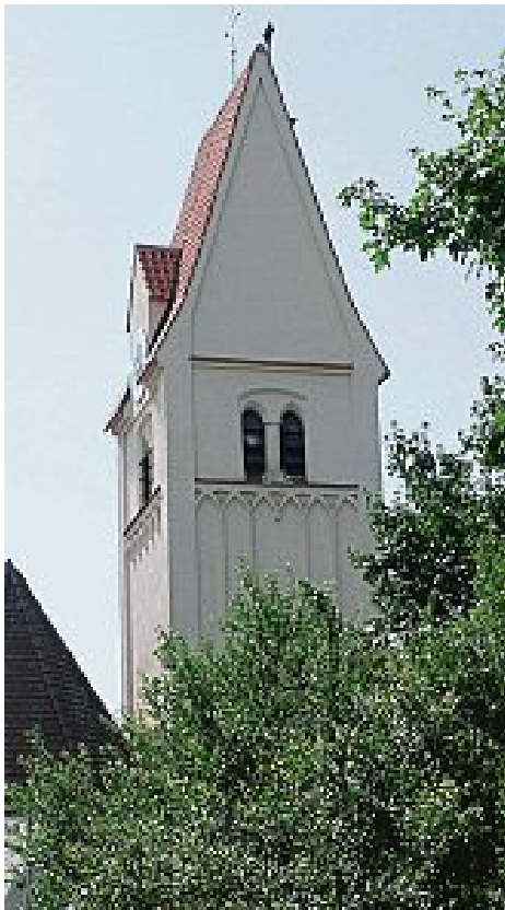
Kirchturm in Überacker