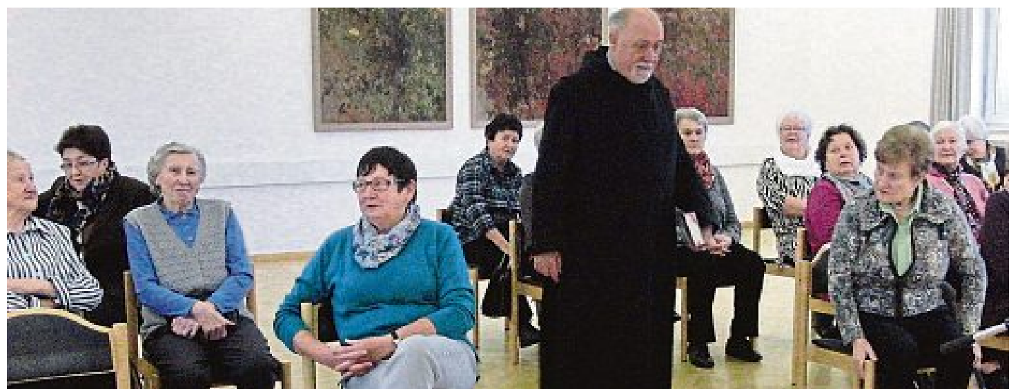
Pater Claudius war während seines Vortrages voll in Aktion.