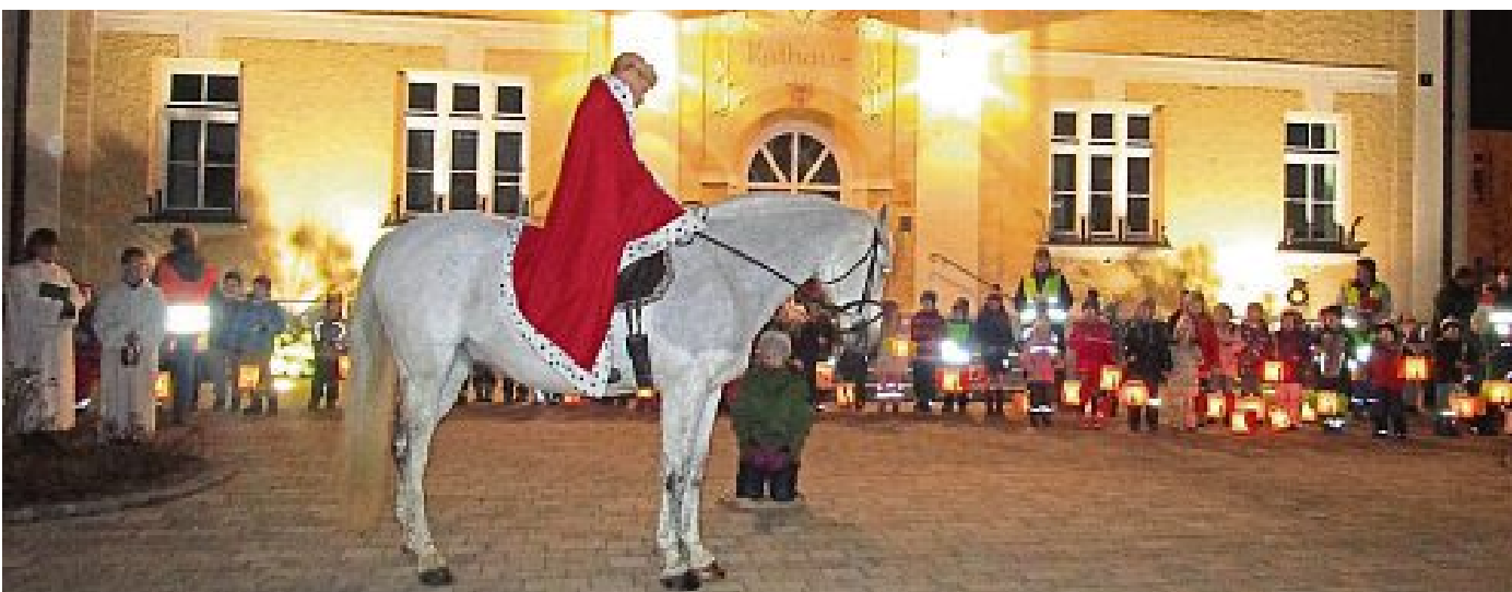
KINDERGARTEN GERMERSWANG

Laternen selbst gebastelt Auch dieses Jahr zogen wieder mehr als 100 Kinder mit ihren bunten selbstgebastelten Laternen durch Maisachs Straßen. Am Rathausplatz angekommen wurde die Martinsgeschichte gesanglich nacherzählt und die Kinder gaben die gelernten Martinslieder zum Besten. Anschließend wurden die Laternen gesegnet, die den Rathausplatz in ein buntes Lichtermeer verwandelten. Gemeinsam mit den Eltern ging es dann zurück zum Kinderhaus, wo es nach Punsch, Gebäck und Leberkäsemmeln duftete.