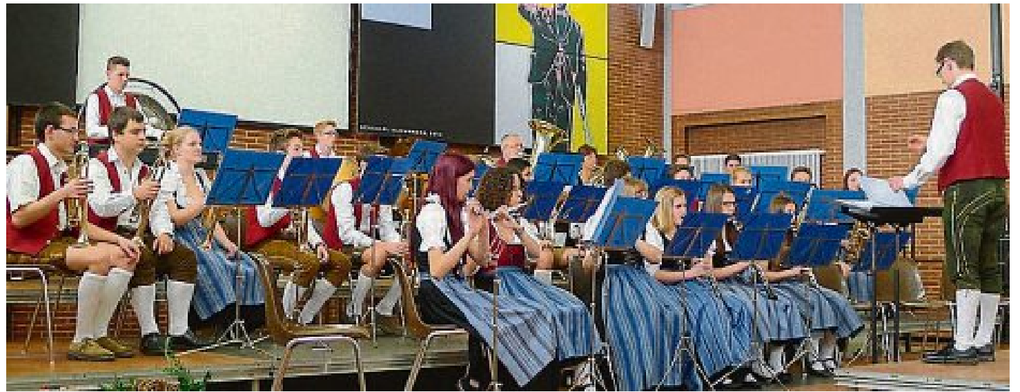
Die Jugendblaskapelle Maisach während ihres Wertungsspiels.

★ Unterstufe: Jugendblaskapelle Maisach (85), Musikver-