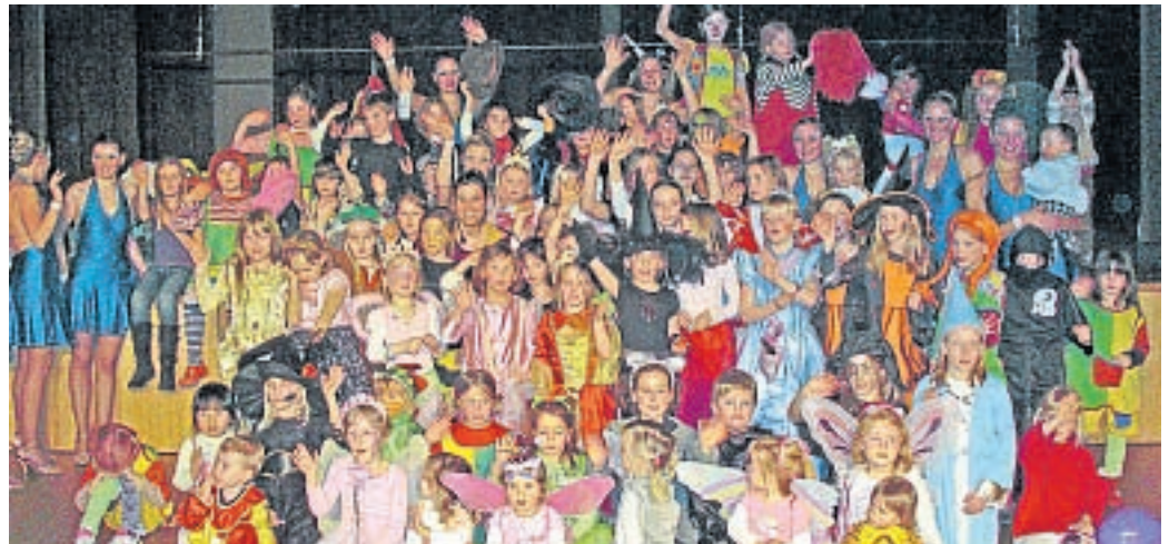
DANCE CORPORATION

Merken Sie sich auch schon den großen Showabend der Dance Corporation am 9. Mai vor, bei dem wieder verschiedenste Showtanz-, Ballett-, Hip-Hop- und Jazz-Gruppen sowie viele weitere Künstler ihr Können präsentieren werden.