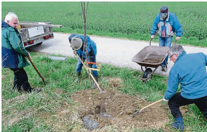
OGV MAISACH

Wie in der Jahreshauptversammlung beschlossen, pflanzte der OGV Maisach in Stefansberg vier neue Halbstammäpfelbäume. Bei allen Bäumen wurde ein Maschendraht gegen den Wühlmausverbiss angebracht. Nach der vorbildlichen Fixierung der Äpfelbäume darf auf ein gutes Wachstum gehofft werden.