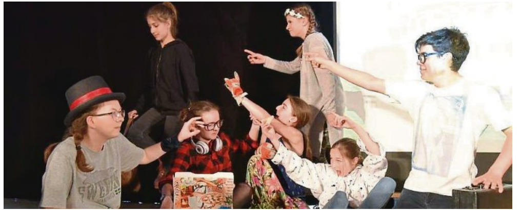
REALSCHULE MAISACH/FOTO: TB

Theater in Eigenproduktion Seit Beginn des Schuljahres hatte die Theatergruppe der Orlando-di-Lasso-Realschule für die Aufführung ihres Stücks „Abwege – Die Reise, die so nicht geplant war“ geprobt. Am 26. April war es soweit: Die 22 Schülerinnen und Schüler aus den Jahrgangsstufen 6 bis 10 brachten ihre Eigenproduktion unter der Leitung von Frau Graunke und Herrn Haslauer mit großem Erfolg auf die Bühne: Begeistert verfolgte das Publikum, wie eine aus den unterschiedlichsten Charakteren bestehende Reisegruppe verzweifelt versuchte, ihr Ziel, den Starnberger See, zu erreichen. Denn statt an dem bayerischen Gewässer anzukommen, landete die Gruppe in den unterschiedlichsten Ländern der Erde. Den jeweiligen Weg dorthin nahmen die Schauspieler, indem sie sich selbst für jede Szene in ein anderes Fortbewegungsmittel verwandelten, bevor sie als Flugzeug, Schiff, Hundeschlitten oder Bus in Italien, Osteuropa, China, am Nordkap und in Las Vegas landeten.