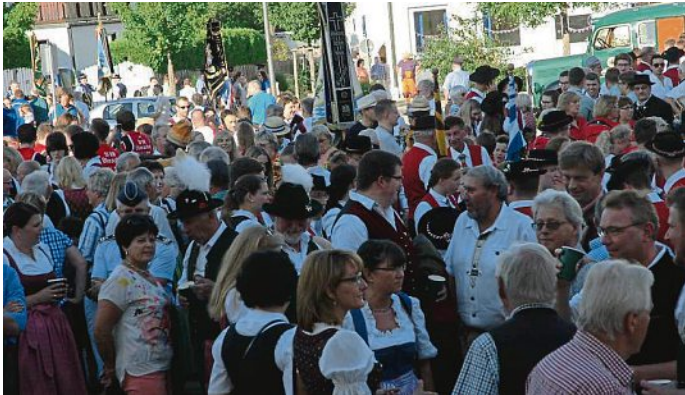
Gemeinsam feiern: Vom 22. bis 24. Juni wird das Ortszentrum im wahren Sinn des Wortes im Mittelpunkt stehen.

vom 22. bis zum 24. Juni feiern wir das Maisacher Ortszentrumsfest, zu dem wir Sie alle sehr herzlich einladen. Für die Gemeinde Maisach gibt es fünf gute Gründe