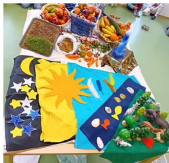
Text/Foto: Maisacher Schülerhort Emmaus

Zum gemeinsamen Erntedankfest im ev. Emmaus Schülerhort der Diakonie FFB brachten alle Kinder Obst und Gemüse mit, um einen kleinen Erntedankaltar zu gestalten. In einer kurzen Andacht wurde die Schöpfungsgeschichte erzählt und dazu ein Mittelbild gelegt. Im Anschluss aßen alle zusammen das mitgebrachte Obst und die selbst ange-säte Kresse auf Butterbrotchen. Alle hatten große Freude und Spaß an der schönen Feier.