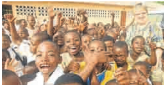
Es lohnt sich, denn die Kinder in Togo strahlen, wenn sie in die Schule gehen können.

Das Grundstück stellt der Dorfschaf zur Verfügung. Die Menschen vor Ort sind bereit, ihre Arbeitskraft als Eigenleistung einzubringen. Es fehlt nur noch das Geld für das Baumaterial und die Bau-Fachkräfte. Helfen Sie jeder mit einer Spende von zwei Euro. Mehr Informationen, unter anderem zu den Kontonummern, erhalten Sie im Internet unter www.aktionpit.com .