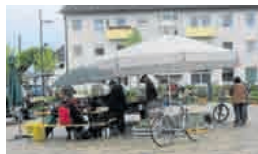
OGV MAISACH

Der Obst- und Gartenbauverein Maisach veranstaltete Anfang Mai den zweiten Pflanzenmarkt auf dem Rathausplatz. Trotz zunächst regnerischen Wetters war der Markt von Käufern und Verkäufern gut besucht. Die Interessierten konnten Pflänzchen aller Art erwerben. Gegen Ende des Marktes ließ sich sogar noch die Sonne blicken.