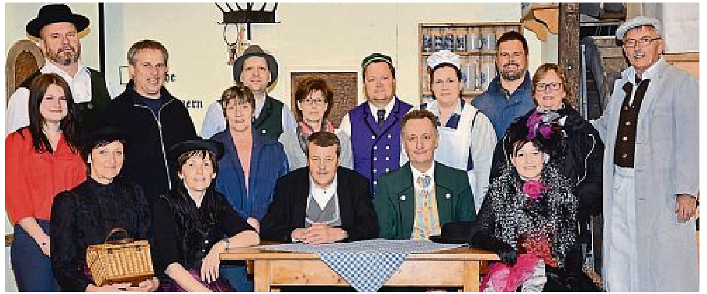
ELTERNBEIRAT GRUNDSCHULE MAISACH/FOTO: TB

Theatergruppe Die Theatergruppe des SC Maisach glänzte mit sechs ausverkauften Theateraufführungen im Stadl in Diepoltshofen. Aufgeführt wurde die bayerische Komödie in drei Akten „Da Leftutti“ von Peter Landstorfer. Der Autor ließ es sich nicht nehmen, sich eine der Aufführungen selbst anzuschauen und war von den Darbietungen der erfahrenen Maisacher Theaterbühne sehr begeistert. Auch alle anderen Besucher amüsierten sich köstlich und sparten nicht mit Beifall für die Akteure und das hervorragende Bühnenbild.