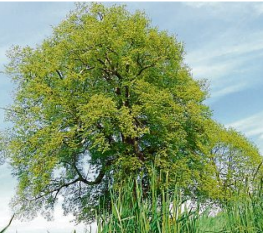
Was ist wo? Diese Linde ist mit ihrem Alter von ungefähr 400 Jahren mittlerweile einer der ältesten Bäume in der Gemeinde. Wo sie steht, können Sie auf Seite 15 nachlesen.