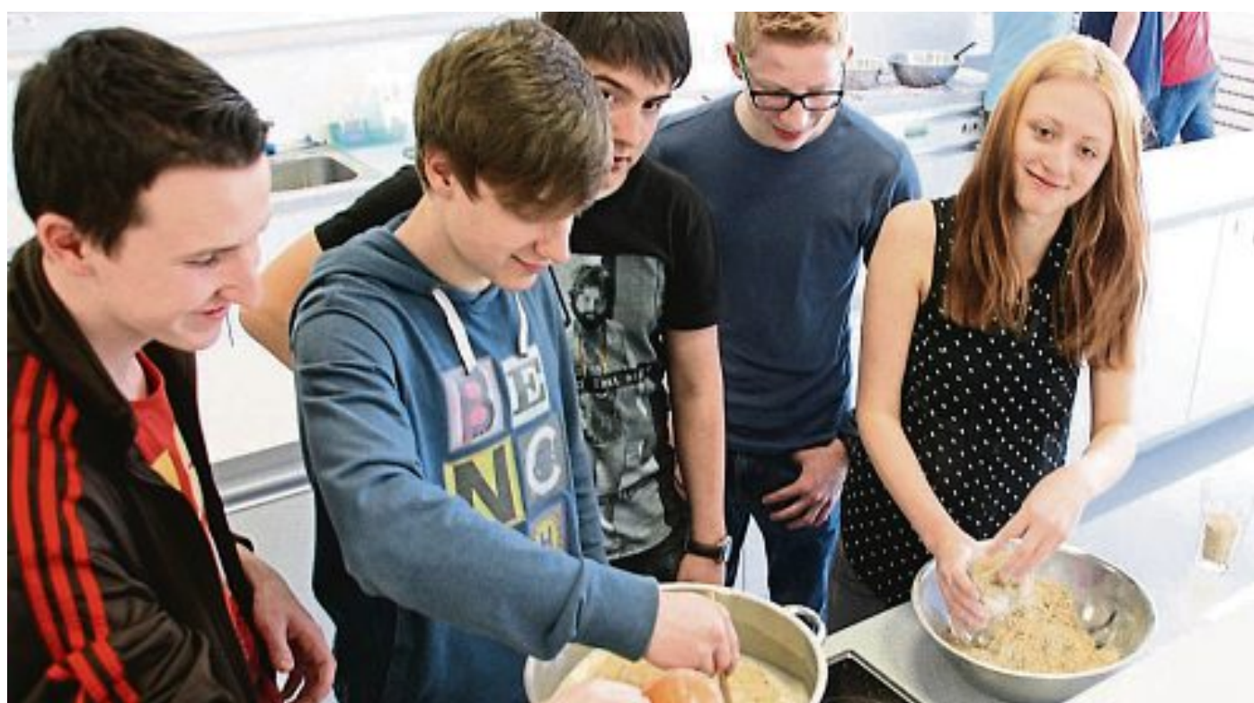
Bierprojekt Zwölf Schülerinnen und Schüler der Orlando-di-Lasso-Realschule Maisach brauten im Rahmen eines Projekts im Chemieunterricht ihr eigenes Bier. Dabei lernten sie alle nötigen Verarbeitungsschritte des Brauens kennen, so wie Schrotten, Maischen oder Filtrieren. Sechs Wochen später wurde dann der eigene Gerstensaft verkostet.