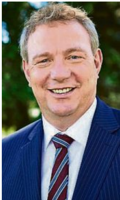
Liebe Mitbürgerinnen und Mitbürger,

am 15. Mai wurde die Badesaison in unserem Freibad eröffnet. Während der nun kommenden Badesaison bis September hoffen wir auf möglichst viele sonnige Tage, die zahlreiche Badegäste für den erfrischenden Badespaß begeistern.