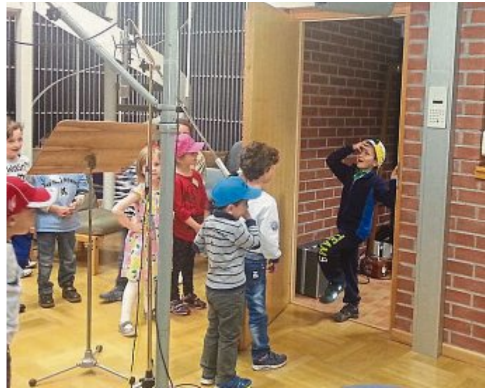
KINDERHAUS ST. VITUS

Am 6. Mai besuchten die Vorschulkinder der Marienkäfer- und Spatzengruppe aus dem Kinderhaus St. Vitus in Maisach den Bayerischen Rundfunk in München. In einem Studio durften die Kinder verschiedene Geräusche selbst erzeugen und eine kleine Geschichte mit Geräuschen untermalen. Außerdem wurden die Kinder zu ihren Muttertagsgeschenken interviewt. Vielleicht hat uns ja der eine oder andere im Radio auf Bayern 3 gehört.