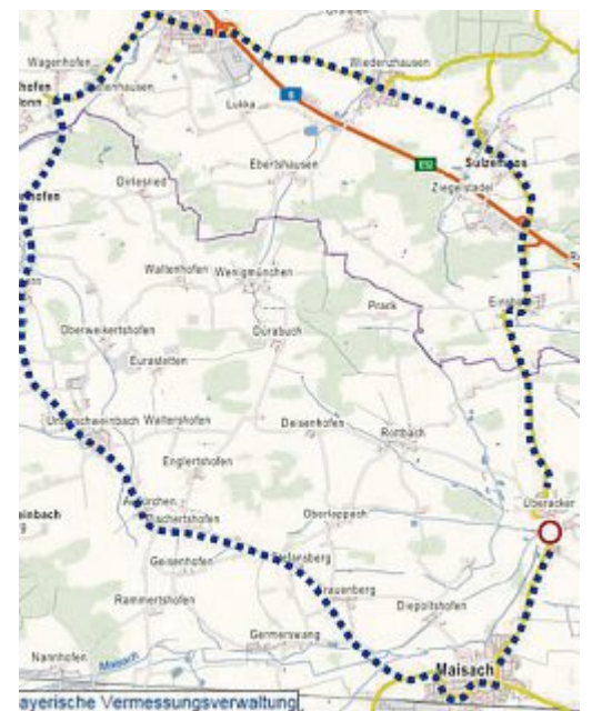
Brücken-Neubau in Überacker