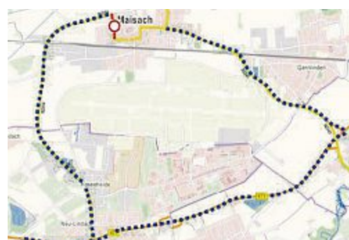
Sanierung Ortsdurchfahrt Maisach.