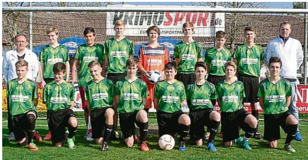
SV ROT-WEISS ÜBERACKER

Neue Trikots für Nachwuchsfußballer Die C-Junioren des SC Maisach in ihren neuen Trikots. Wir bedanken uns bei der Firma Josef Erhard GmbH.