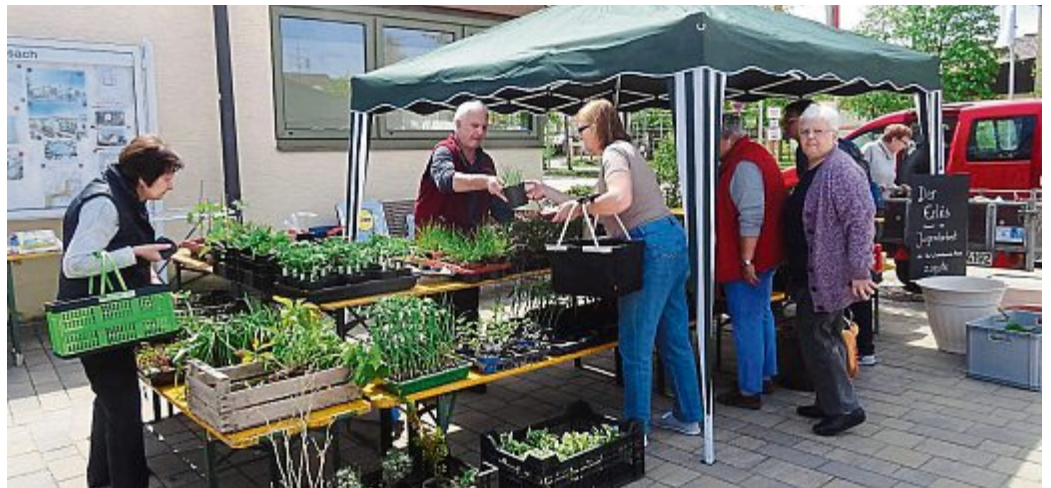
OBST- UND GARTENBAUVEREIN MAISACH/FOTO: TB

Unter dem Motto „Übrige Pflanzen wegwerfen??? Viel schade!!!“ veranstaltete der Obst- und Gartenbauverein Maisach am 6. Mai wieder seinen traditionellen Pflanzenmarkt auf dem Rathausplatz. Nach den vielen Regentagen war Petrus uns wohlgesinnt und ließ die Sonne mal wieder scheinen. Die vielen Besucher waren über das große Angebot der zum Verkauf oder Tausch angebotenen Gemüsepflanzen, Blumenpflanzen, Stauden und Pflanzenzubehör begeistert. Das Gartlercafé hatte alle Hände voll zu tun. An diesem schönen Tag schmeckte der Kaffee mit selbstgebackenen Kuchen besonders gut. Ein herzliches Dankeschön nochmals an unsere großzügigen Kuchenspender!