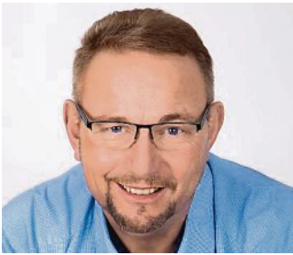
Liebe Mitbürgerinnen und Mitbürger,

Tage mit wärmenden Sonnenstrahlen locken uns alle verstärkt ins Freie. Mit allen Sinnen nehmen wir das Erwachen des Frühlings wahr. Obwohl wir einen milden Winter erleben durften, tut jeder Tag mit warmen Temperaturen Mensch und Natur gut. Die Tage werden länger, erstes Grün auf Bäumen und Sträuchern spitzt hervor, und schon am frühen Morgen begrüßen uns wieder zahlreiche Vogelstimmen.