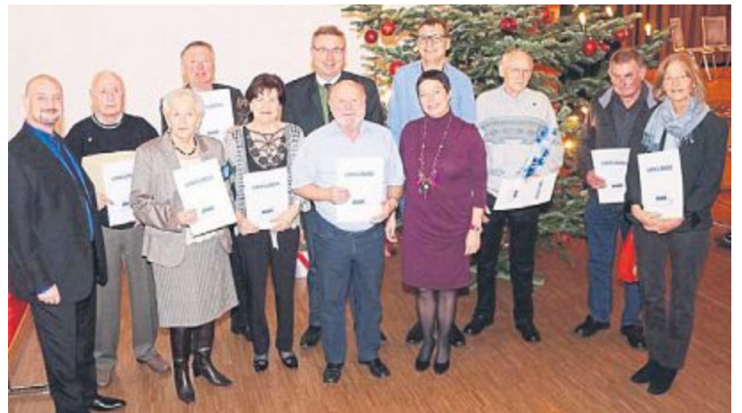
VDK GERNLINDEN/KREBSKRANKEN KINDERN HELFEN