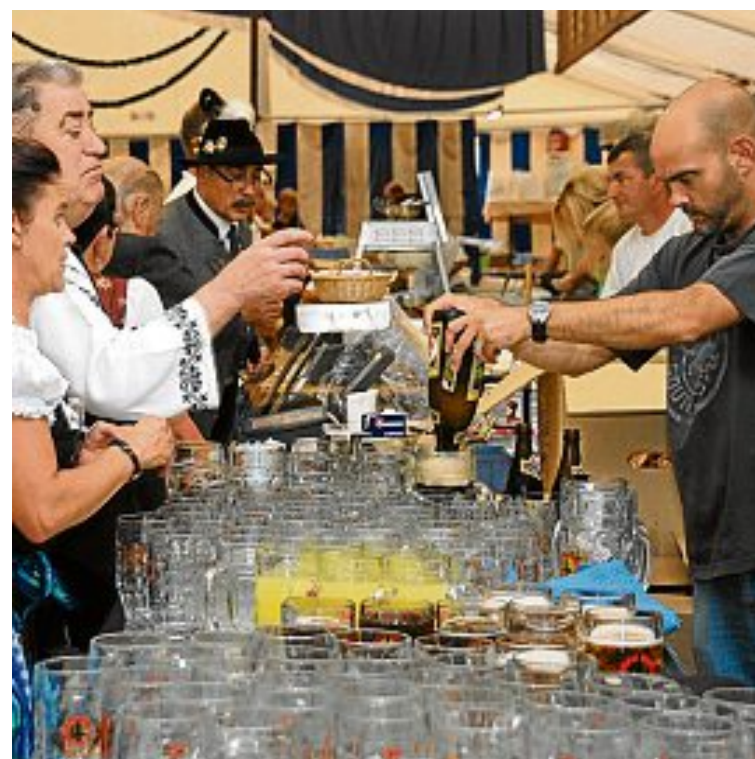
Fleißig und mit Freude angepackt hat das Personal auf der Festwoche.