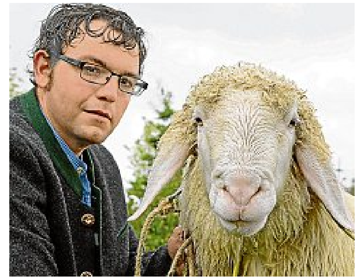
Bei der Schaf- und Ziegenprämierung mussten Mensch und Tier dem Regen trotzen.