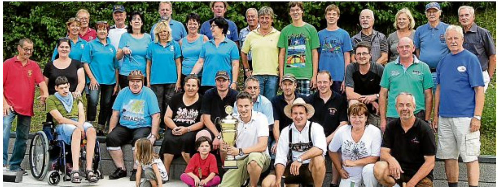
Das traditionelle Stockschießen um den Lorenz-Schanderl-Wanderpokal fand im Rahmen der diesjährigen Maisacher Festwoche mit Maisacher Hobbystockschützen statt. Der Reinerlös des Turniers geht in diesem Jahr an das Dominikus-Ringeisen-Werk. Über Turnier und Spendenübergabe erfolgt ein gesonderter Bericht.