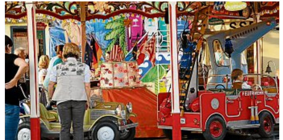
Spiel und Spaß – das gab es auf der Maisacher Festwoche auch wieder für die jüngsten Besucher.