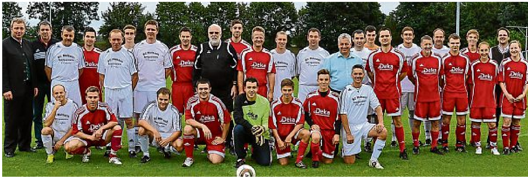
Den Fußballsieg in diesem Jahr holte sich das Team der Gemeinde Maisach gegen die Sparkassenmannschaft. Diese Partie wird traditionell während der Maisacher Festwoche beim SC Maisach ausgetragen.