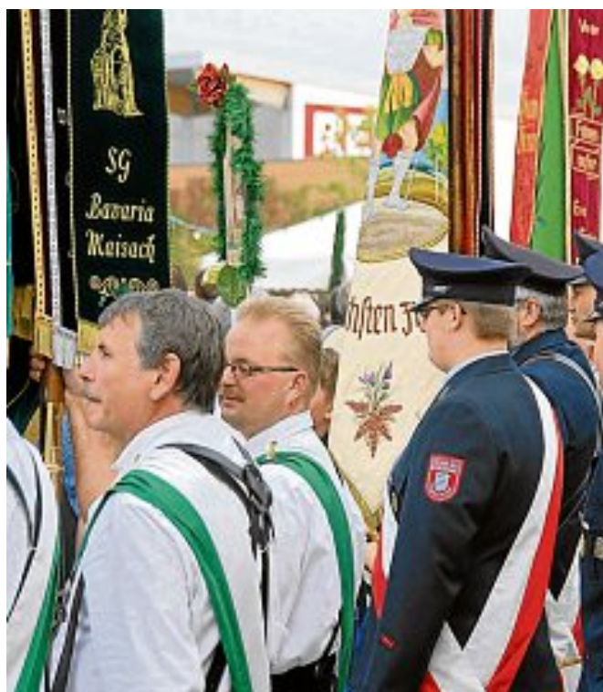
Festlich geschmückte Fahnen gaben beim Einzug ein prächtiges Bild ab.