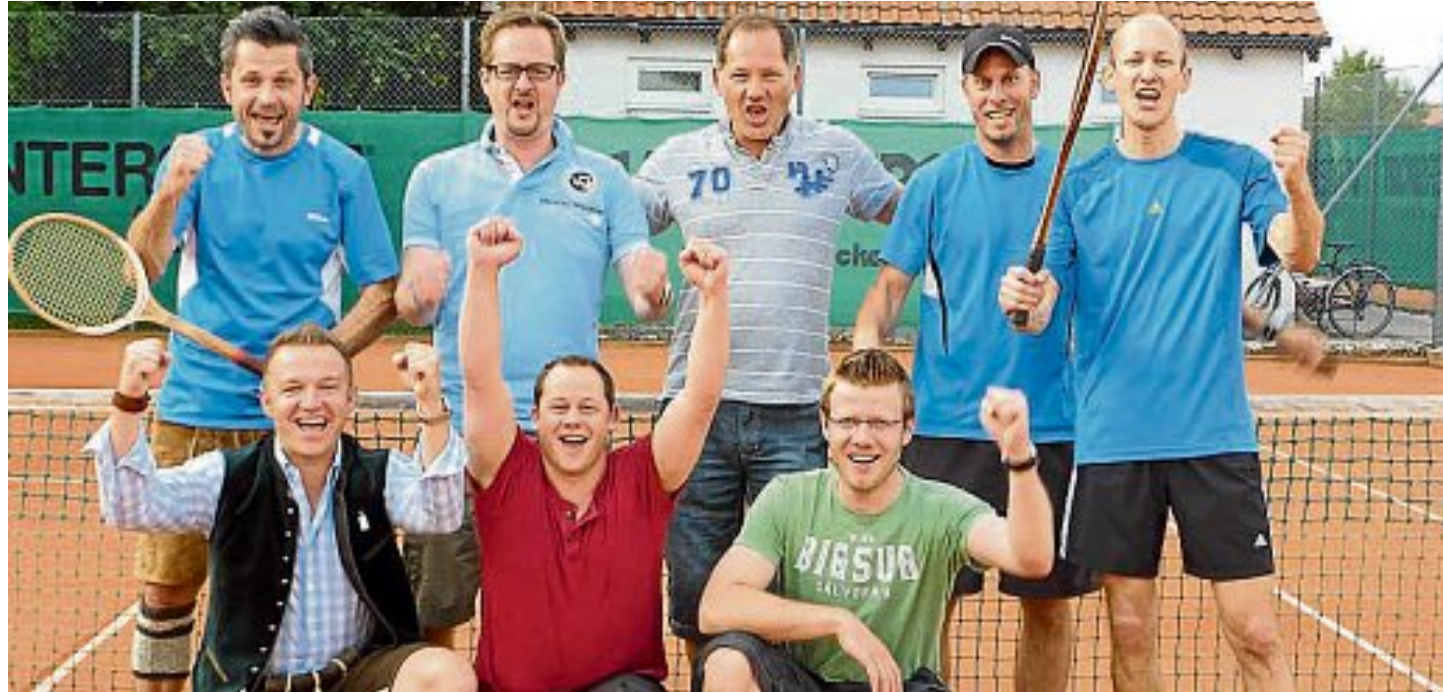
TG GERMERSWANG

Nach dem zweiten Platz im letzten Jahr konnte die Tennisgemeinschaft Germerswang diese Saison den Meistertitel erringen. Bis zum letzten Spieltag war die Mannschaft ungeschlagen und der erste Platz war bereits gesichert. Lediglich im letzten Match wurde die Siegesserie gestoppt. Dies sollte aber die Feier nicht trüben.