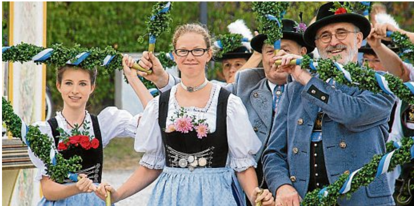
Tradition groß geschrieben wird ebenso beim Einzug auf der Maisacher Festwoche. Die beteiligten Gruppen und Vereine nehmen daran mit viel Engagement teil.