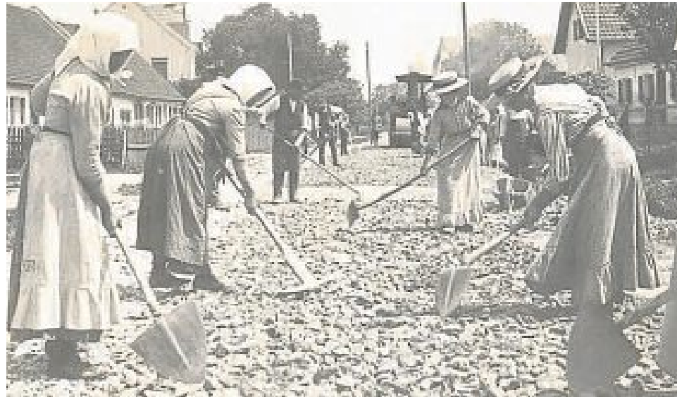
Ausbau der Bezirksstraße Maisach – Egenhofen/Weyern 1915/1916: „Weibliches Arbeitskommando“ in der heutigen Aufkirchner Straße in Maisach.