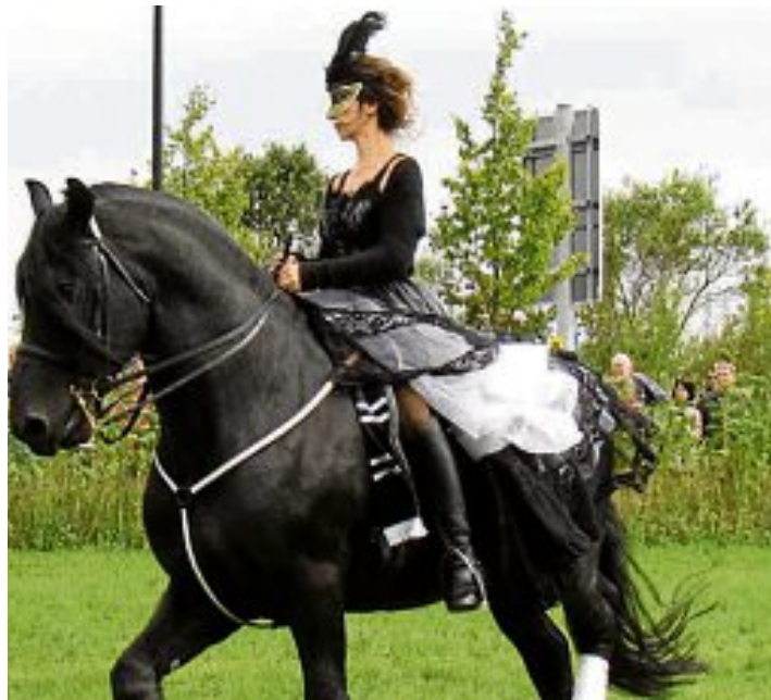
Der erste Pferde-Erlebnistag auf der Maisacher Festwoche machte seinem Namen Ehre: Er war für alle Besucher ein Erlebnis.