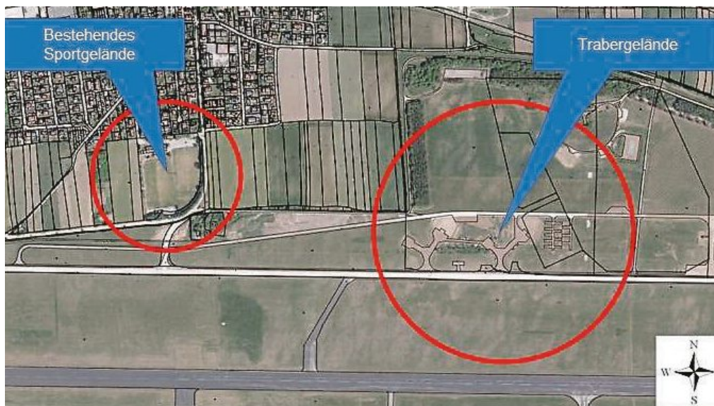
Auf diesem Plan sind SC Maisach und Trabergelände markiert.

Die verkehrliche Anbindung des Trabergeländes mit