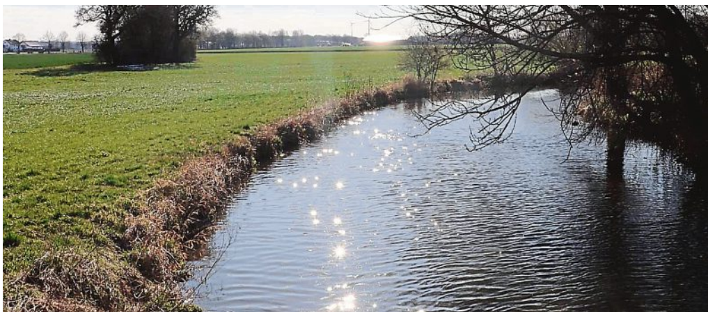
Die Maisach im Gegenlicht bietet in diesen Tagen einen beruhigenden Blick.