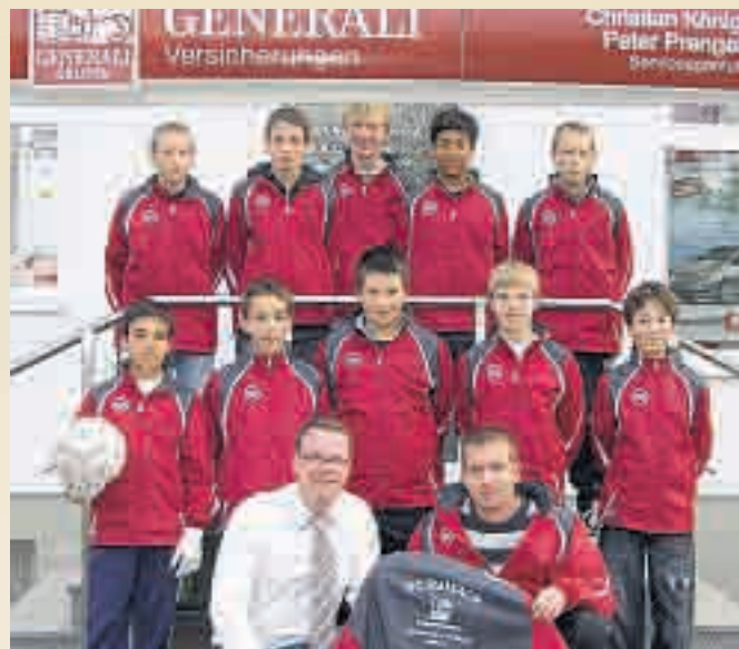
Die Agentur Christian König unterstützt auch gern die örtlichen Vereine und sponserte neue Regenjacken für die Jugend des SC Maisach.

Die Agentur Christian König ist Vertriebspartner der Generali Versicherungen, die mit über zwei Milliarden Euro Beitragseinnahmen und rund 12 Milliarden Euro Kapitalanlagen eines der bedeutendsten Finanzdienstleistungsunternehmen am deutschen Markt sind.