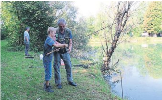
Unter Anleitung der Waldseefischer Gernlinden durften „Jungfischer“ die Angel auswerfen und dann den Fang mit nach Hause nehmen.