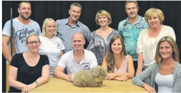
SC MAISACH

Heimatbühne Für das neue Herbststück der Heimatbühne Gernlinden wird schon fleißig geübt. Gespielt wird das Stück „Deifi Sparifankerl“. Der fidele Teufel Sparifankerl soll den jungen Bertl zu Untaten anstiften. Aufführungen sind am 29. Oktober, 5., 11. und 12. November jeweils um 20 Uhr sowie am 29. Oktober nachmittags um 14 Uhr. Kartenvorverkauf ist ab 22. Oktober von 9 bis 11 Uhr und am 24. Oktober von 18 bis 19 Uhr im Bürgerzentrum Gernlinden sowie ab 25. Oktober telefonisch unter Nr. 08142/488596. Kartenverkauf für die Nachmittagsvorstellung an der Tageskasse ab 13 Uhr. Wir freuen uns auf Ihren Besuch.