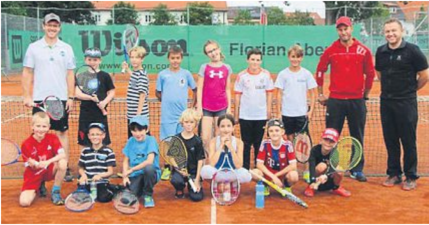
Bei der Tennismgemeinschaft Gernerswang wurde den Kindern der Tennissport näher gebracht und sie konnten ein gutes Gefühl für den Umgang mit Tennisschläger und -ball gewinnen.