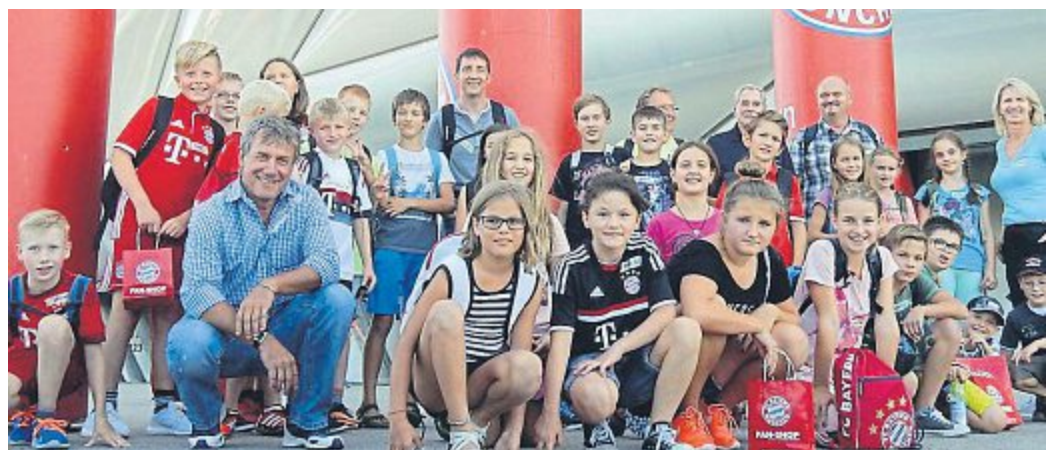
In einer Führung, die die Freien Wähler in der Allianz-Arena organisierten, erlebten 30 Mädchen und Jungs die einzigartige Atmosphäre aus der Sicht eines Profifußballers, bevor es dann weiter in die spannende „FC Bayern Erlebniswelt“ ging.

Krankengymnastik Fango ▪ Massage Wellness Termin: 08141/5091130 www.physiotherapie-dombo.de Frauenstr. 31 · 82216 Maisach Schöngeisinger Str. 36a 82256 Fürstenfeldbruck