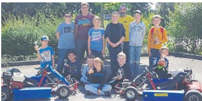
Wie man ein Kart sicher fährt, lernten die Kinder beim Schnuppertag des MC Würmtal, Ortssitz Maisach . Die Kinder durften auf dem Parcours mit ganz verschiedenen Aufgaben außerdem ihre Geschicklichkeit unter Beweis stellen.