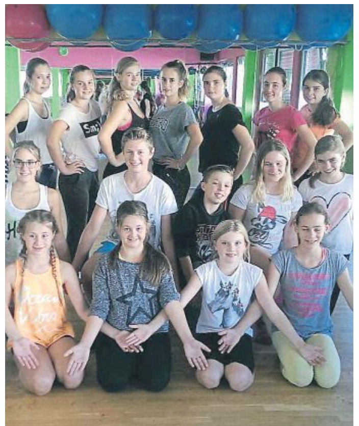
DANCE CORPORATION/FOTO: TB

Gernlinden- Wie die Großen so die Kleinen..., denn langsam geht es bei der Dance Corporation Maisach in die „heiße Phase“. Bereits seit Juni trainieren die Kinder- und die Erwachsenengruppe wieder fleißig für die anstehende Präsentation ihrer neuen Showprogramme am Samstag, 26. November, im Bürgerzentrum Gernlinden; Einlass ist um 19 Uhr, Beginn um 20 Uhr. Der Spaß am Tanzen steht dabei natürlich stets im Vordergrund: neben Auftritten der beiden Vereinsgruppen dürfen die Gäste auch selbst das Tanzbein schwingen; musikalische Unterstützung gibt es von der Liveband „Die Performer“. Der Kartenvorverkauf startet wie jedes Jahr am 11. November – und Sie sind ganz herzlich dazu eingeladen! Nähere Informationen unter der Mobilnummer 0176/29088531 oder auf unserer Facebook-Seite. Wir freuen uns auf Sie.