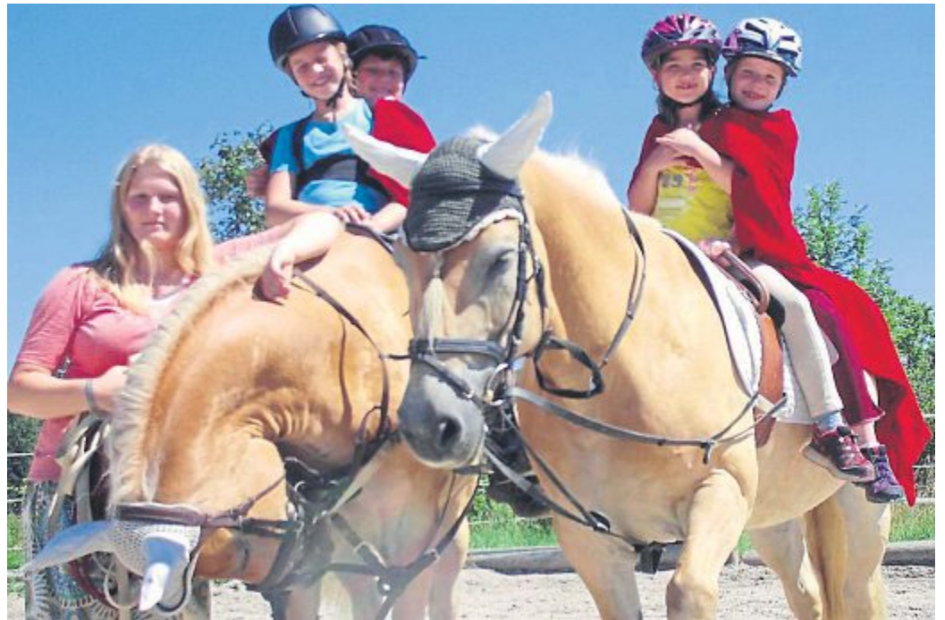
Putzen, Satteln, Voltigieren und natürlich auch ein kleiner Ausritt gehörten zur Veranstaltung „Heilpädagogisches Reiten“, einem Angebot der Gemeinde Maisach .