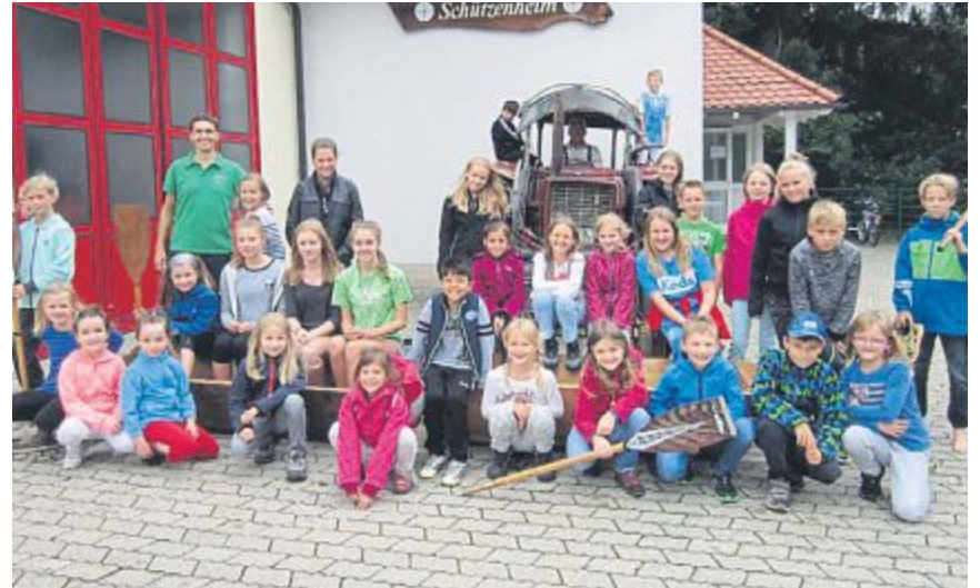
Obwohl es die Maisach heuer schnell gemacht hat beim Sautrogrennen der Almrauschschützen Gernerswang , haben die Kinder alles heil und in geordneten Bahnen überstanden.