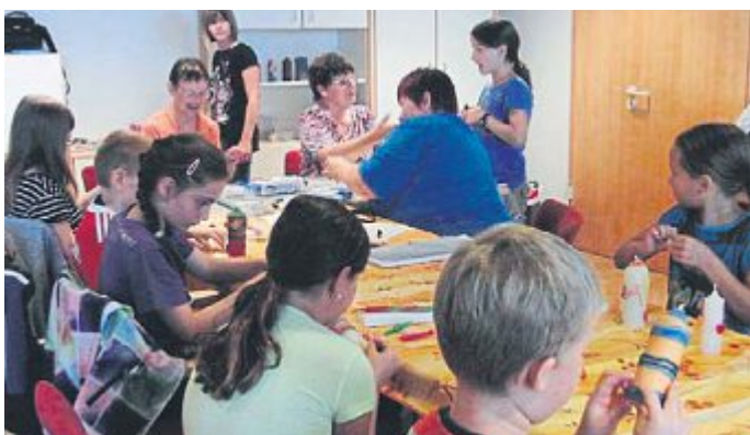
Genau 22 Kinder lernten beim Katholischen Frauenbund Maisach wie man aus Wachs von Kerzenresten wunderschöne Kerzen basteln kann und durften eine große und kleine Kerze, verziert und gestaltet nach eigenem Geschmack, mit nach Hause nehmen.

Zahlreiche Kinder und Jugendliche haben im August und September an unserem gemeindlichen Ferienprogramm teilgenommen. Es konnten 33 interessante Veranstaltungen angeboten werden: Spiele, Sport und verschiedene Ausflüge standen ebenso auf dem Programm wie Basteln, Kochen oder Theaterspielen. Zahlreiche ehrenamtliche Betreuerinnen und Betreuer sorgten wieder für den reibungslosen Ablauf der Veranstaltungen und das leibliche Wohl der teilnehmenden Kinder und Jugendlichen. Wir bedanken uns bei unseren Ortsvereinen und allen Helferinnen und Helfern für die guten Ideen und das große Engagement. Sie alle haben mitgeholfen, die Ferien für unsere Schulkinder wieder abwechslungsreich zu gestalten!