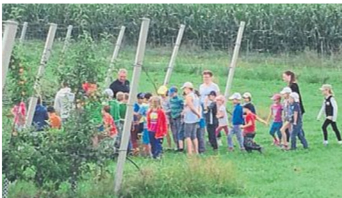
Woher kommt unser Essen? Unter diesem Motto hat der CSU-Ortsverband mit einer Rundfahrt quer durch die Gemeinde die Nahrungsmittelerzeugung auf mehreren landwirtschaftlichen und Gartenbaubetrieben den 40 Kindern näher gebracht.