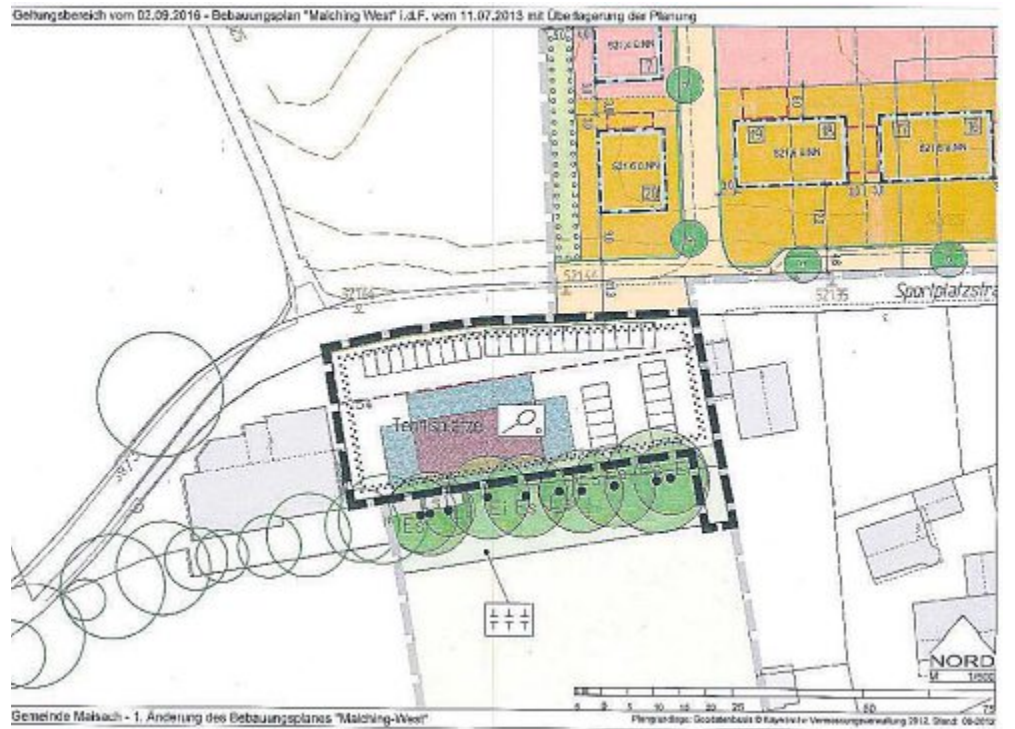
Gemeinde Maisach - 1. Änderung des Bebauungsplans "Malching-West"

Neue Gerätehalle für SC Malching erforderlich Der Sportclub Malching e.V. beabsichtigt den Bau einer Gerätehalle auf dem Gelände der momentan bestehenden beiden Tennisplätze. Diese sollen zurückgebaut werden, da kein aktiver Tennis-Spielbetrieb mehr stattfindet. Für die Errichtung der Gerätehalle muss allerdings der Bebauungsplan „Malching-West“ geändert werden, da die hierin festgesetzte Fläche für „Tennisplätze“ zu einer „Fläche für Sport- und Spielanlagen“ auszuweisen ist. Der Gemeinderat Maisach hat in seiner Sitzung am 22. September 2016 der erforderlichen Bebauungsplanänderung zugestimmt und gleichzeitig den Auftrag hierzu vergeben. Ebenfalls beschlossen wurde vom Gemeindegremium, dass im Bebauungsplanentwurf der südlich vorhandene Baumbestand zu sichern, die geplanten Stellplätze durch Baumpflanzungen zu gliedern und die Zufahrt zum südlichen landwirtschaftlichen Anwesen festzusetzen sind.