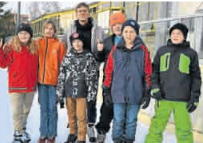
Zum Jahresabschluss 2012 unternahmen die Kinder der Jugendbegegnungsstätte Maisach und ihre Betreuer einen Ausflug aufs Eis ins Fürstenfeldbrucker Eisstadion.