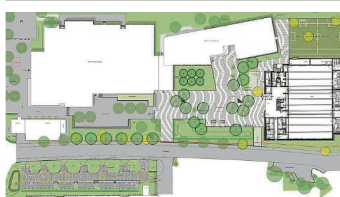
Plan der Außenanlagen. GRAFIK: GÄNSSLE, HEHR + PARTNER LANDSCHAFTSARCHITEKTEN