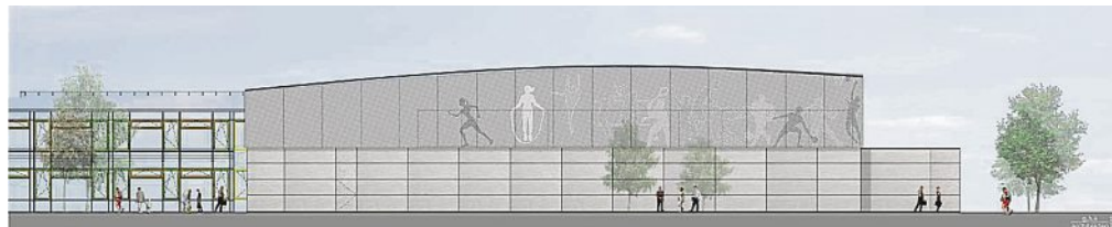
Oben die Ansicht der Halle von Osten her, unten von Süden.

Die Dreifachturnhalle der Realschule Maisach weist einen erheblichen Sanierungsbedarf auf. Insbesondere im Winter werden Schüler und außerschulische Nutzer damit konfrontiert. Aus Sicherheitsgründen muss die Halle bei zu hoher zusätzlicher Auflast für die Nutzung gesperrt werden. Neben dem Dachtragwerk ist auch ein Sanierungsbedarf bei der Heizung, der Fassade und den Fenstern festgestellt worden.