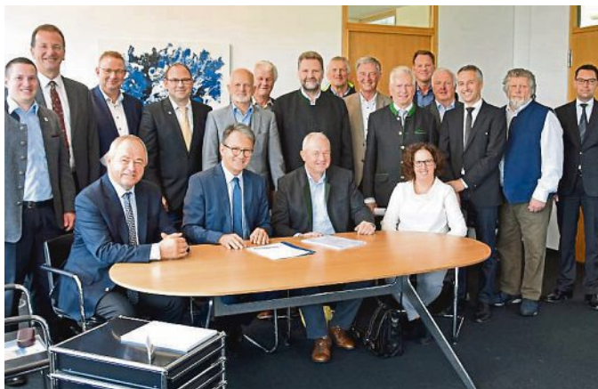
Feierliche Unterzeichnung des Vertrags zur Gründung einer Wohnungsbaugesellschaft GmbH für den Landkreis Fürstenfeldbruck.

Der GmbH gehören diese kommunalen Gesellschafter an: Adelshofen, Alling, Altheim, Egenhofen, Emmerring, Gröbenzell, Hatzenhofen, Landsberied, Maisach, Mammendorf, Mitteltetten, Schöngesing, Türkenfeld, Fürstenfeldbruck, Germering und der Landkreis Fürstenfeldbruck. Die Stadt Puchheim wird in der neu gegründeten Gesellschaft von der Städtischen Wohnraumentwicklungsgesellschaft Puchheim mbH WEP vertreten. Ziel ist die Errichtung