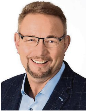
Liebe Mitbürgerinnen und Mitbürger,

am 9. Februar haben wir im Gemeinderat den Haushalt für 2023 und die Finanzplanung bis 2026 beschlossen. Haushaltsplanung und Sicherstellung der finanziellen Stabilität finden jedoch nicht erst bei den Haushaltsberatungen statt. Sie gestaltet sich vielmehr während des ganzen Jahres durch jede einzelne Entscheidung, die zu Ausgaben und Einnahmen getroffen wird. Meine Gedanken zum Haushalt 2023 erlaube ich mir, Ihnen in diesem etwas ausführlicheren „Bürgermeisterbrief“ näherzubringen.