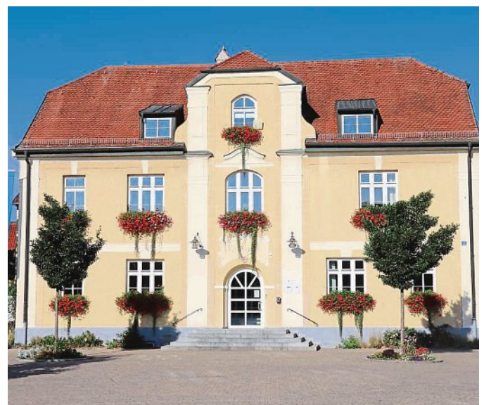
Im Maisacher Rathaus hat man die Entwicklung um den Haushalt stets ganzheitlich im Blick.