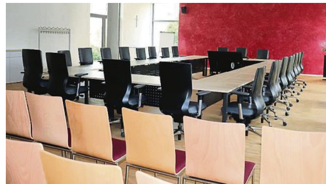
Der Sitzungssaal im Gemeindezentrum war Ort ausführlicher und intensiver Haushaltsberatungen.

Die Herausforderungen ergeben sich insbesondere durch die Struktur unserer Gemeinde. Als Flächengemeinde mit sechs Hauptorten und 25 Gemeindeteilen sind wir wenig mit anderen Kommunen vergleichbar. Bei nahezu gleichwertigen Lebensbedingungen bedeutet das die dauerhafte Finanzierung und den Unterhalt von 13 Kindergärten, sechs Feuerwehren, drei Schulen, drei Turnhallen, der Bücherei, des Jubs, einem Bürgerzentrum, von Rathaus und Bauhof, entsprechendes Personal, einem Gemeindezentrum, fast 100 Wohnungen, vom Schwimmbad, von circa 160 km Straßen, Rad- und Gehwegen, von mehr als 200 Kilometern Glasfaserkabel zur Datenversorgung, von 180 Kilometern Wasserleitungen sowie von mehreren Buslinien und der Schülerbeförderung.