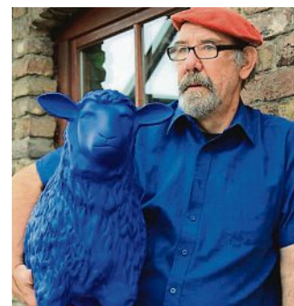
Charme möchten die Blauschafe Denkanstöße geben,